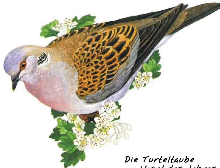
Die Turteltaube Vogel des Jahres